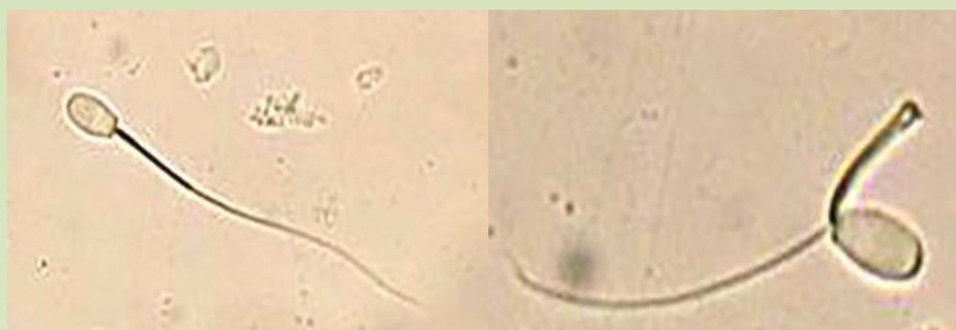
اسپرم با مورفولوژی غیر طبیعی